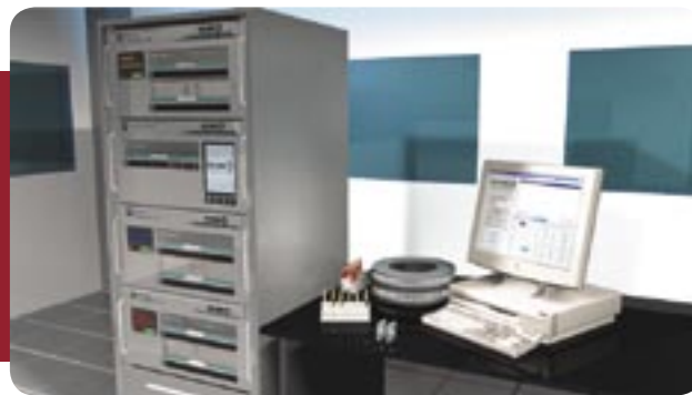
מערכת האבחון המיידית של Pocared. מאפשרת להתמודד עם בעיית המחלות השלישוניות

משברי הוא המבחן העליון לטיב החברה והנהלתה. ביחד עם החברה הצלחנו להתגבר על המשבר ולהחזיר אותה למסלול עסקים תקין. בספר אנה קארנינה כותב טולסטוי שכל משפחה מאושרת באותו אופן אך אומללה בדרכה שלה. אלרון מלווה את חברות הקבוצה גם ברגעים קשים, ומאמינה בפוטנציאל שלהן לטווח ארוך.